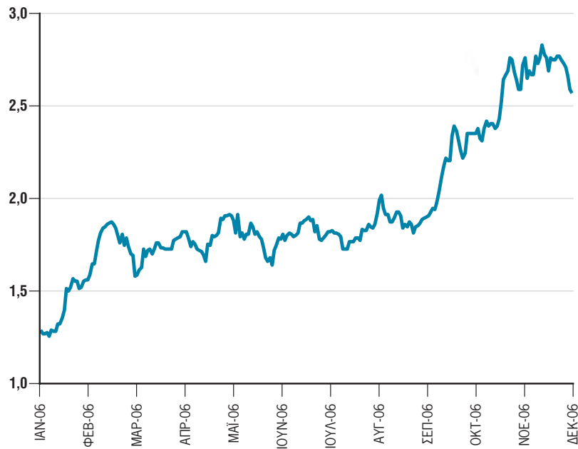
Διάγραμμα όγκου μετοχής 1/1/2006-31/12/2006